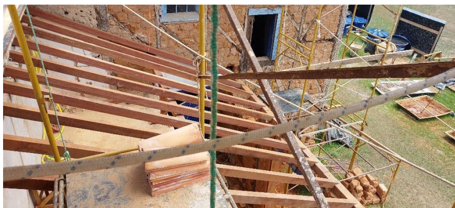
Telhamento em processo de recuperação Data: 16/10/2023