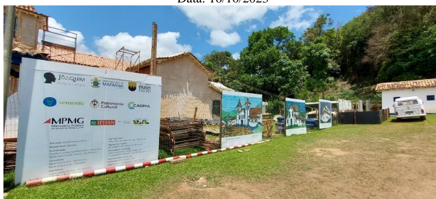
Placa da obra e painéis com pinturas do artista local André Perdigão Autoria: Maria Letícia Ticle Data: 16/10/2023