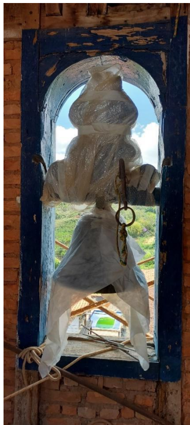
Sinos protegidos Data: 16/10/2023