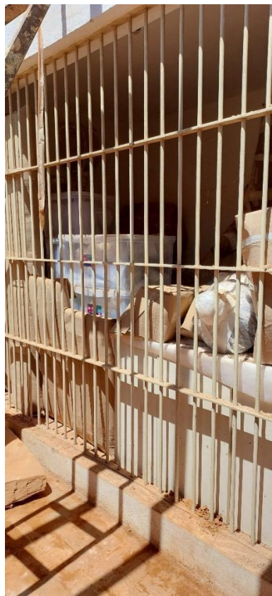
“Cofre” – cômodo com acesso externo onde está guardado parte do acervo de bens móveis Autoria: Maria Letícia Ticle Data: 16/10/2023