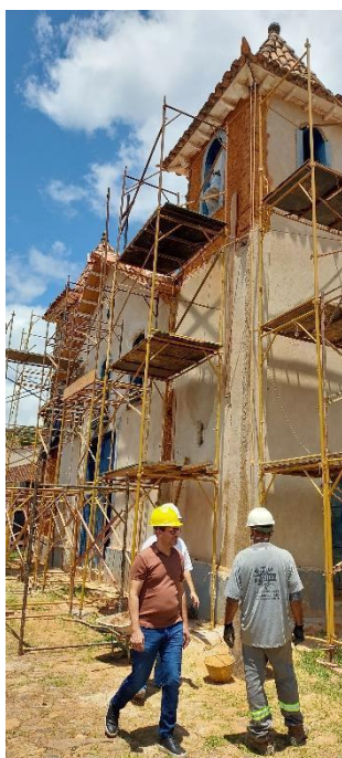
Alvenarias externas com aplicação de reboco Data: 16/10/2023