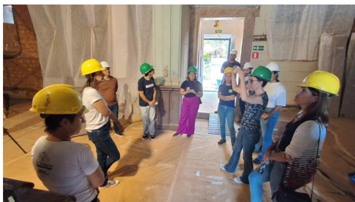
Equipes do Semente, CPPC, Joaquim Artes e Ofícios e IPHAN Autoria: Maria Letícia Ticle Data: 16/10/2023