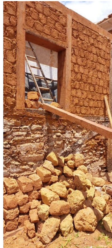
Adobes produzidos in loco Autoria: Maria Letícia Ticle Data: 16/10/2023