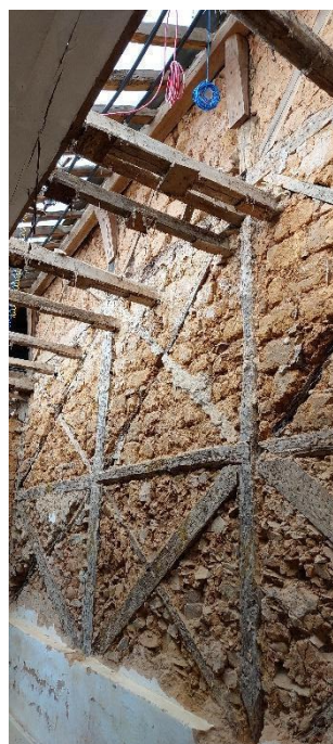
Madeiramento substituído Autoria: Maria Letícia Ticle Data: 16/10/2023