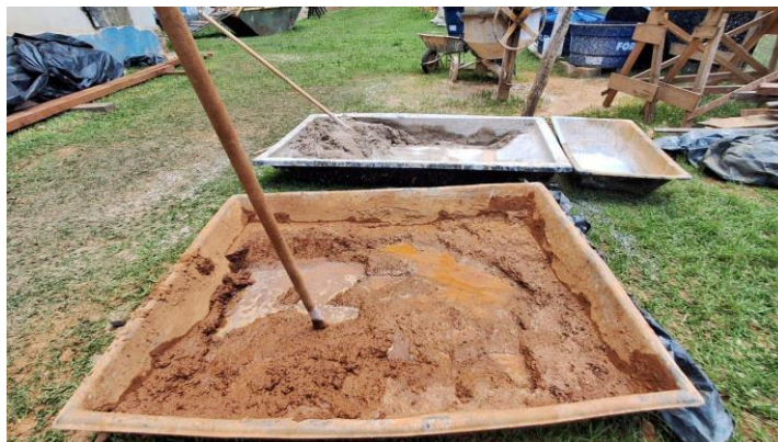
Preparo para tijolos de adobe Autoria: Maria Letícia Ticle Data: 16/10/2023