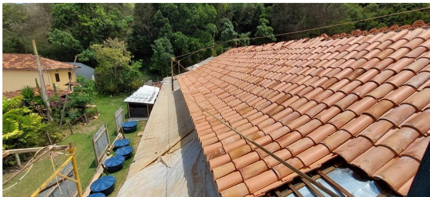
Telhamento recuperado e substituído Data: 16/10/2023