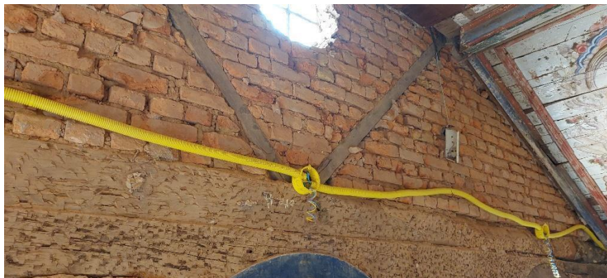
Reboco interno removido e infraestrutura das instalações elétricas concluídas Data: 16/10/2023