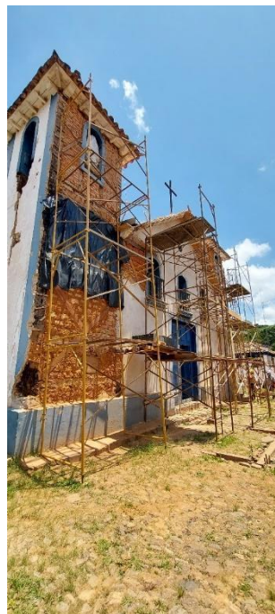
Alvenarias externas Autoria: Maria Letícia Ticle Data: 16/10/2023