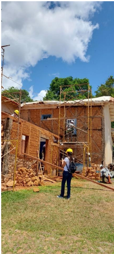
Alvenarias externas de adobe Data: 16/10/2023