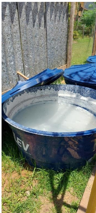
Preparo da cal in loco Data: 16/10/2023